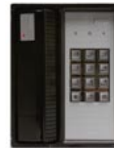
Rugged Keypad Reader