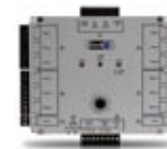
VertX™ 2-х дверный контроллер