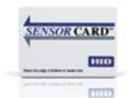
SensorCard™ Wiegand Access Карта