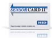
SensorCard II™ Multiple Technology Карта